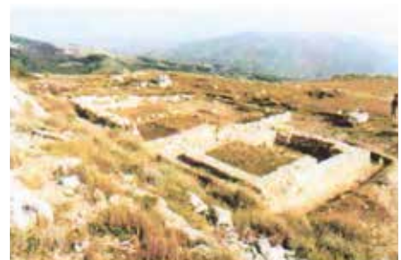
In alto gli scavi archeologici per la messa in luce della chiesa.