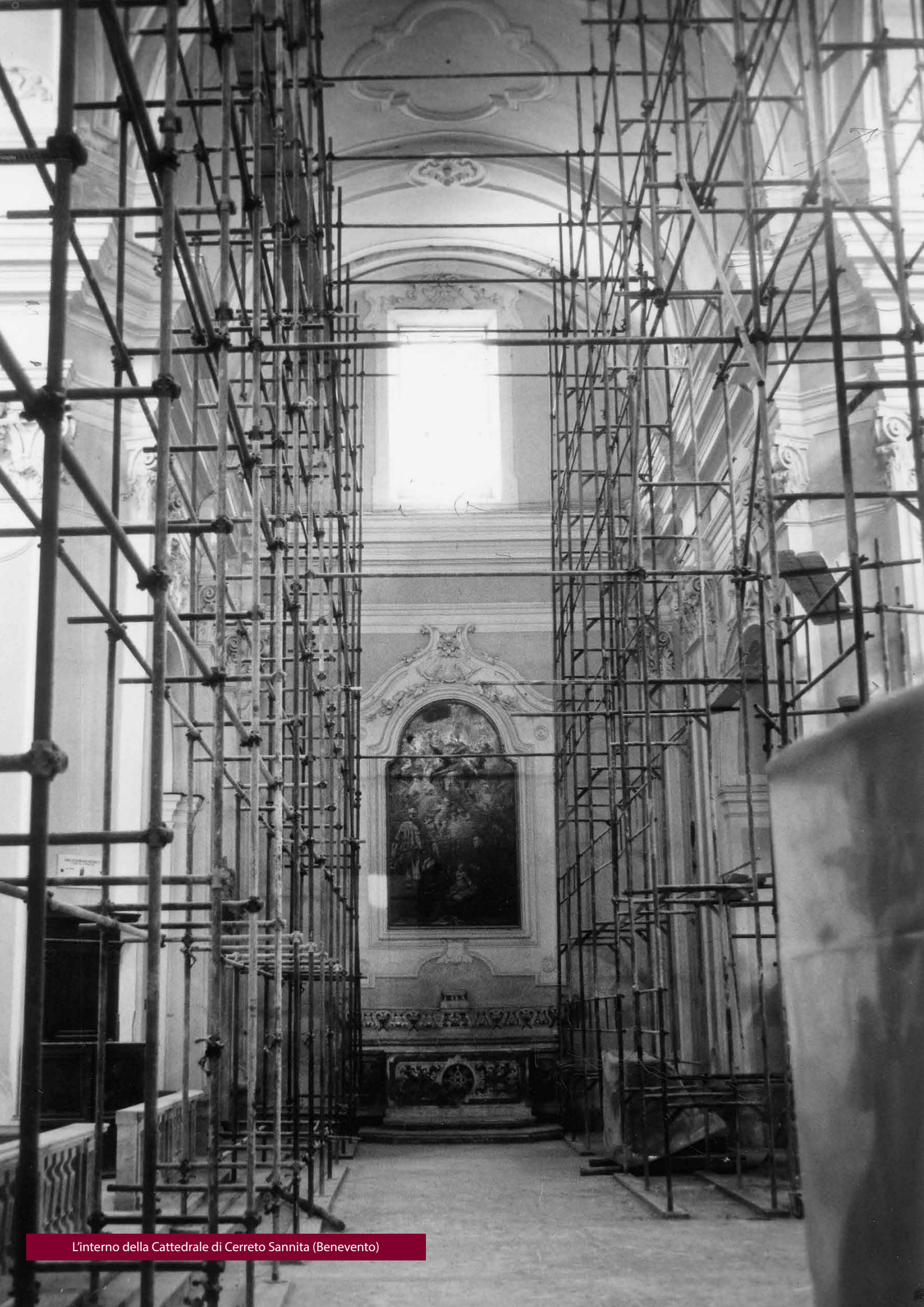
L'interno della Cattedrale di Cerreto Sannita (Benevento)